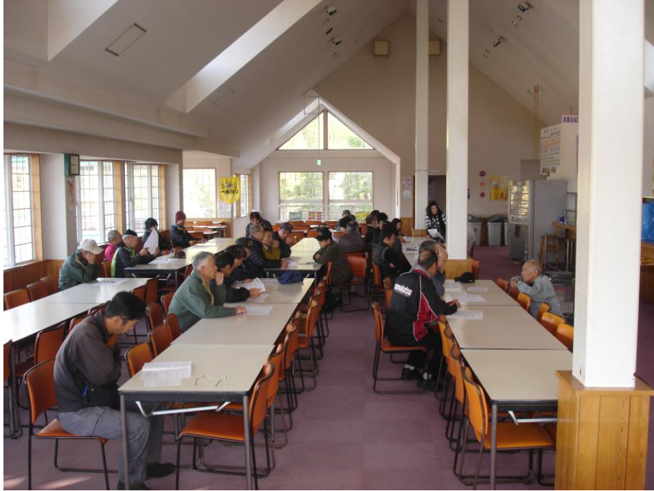
シーズン前顔合わせ

当社では、輸送や皆さまの安全に役立つよう、シーズン営業開始前に顔合わせを行い、施設及び取扱いについての安全教育の実施や、郡上北消防署から講師を招き、心肺蘇生講習、消火訓練、避難訓練を行いました。